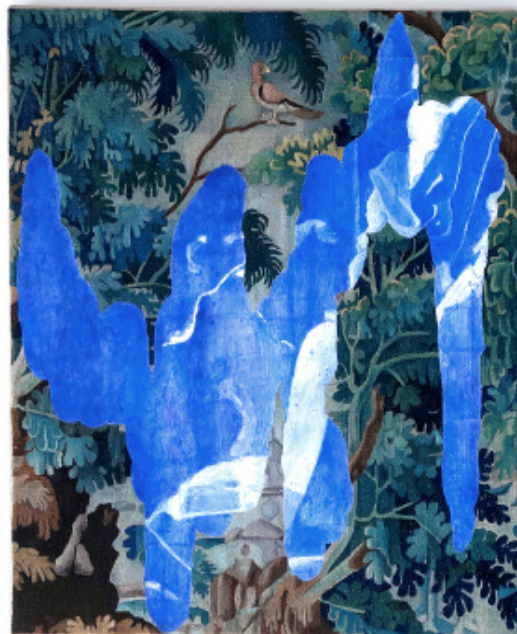
Ci-dessus - Forêt V, 2020, peinture à l'huile et à l'acrylique sur lin, 27 x 22 cm Page de droite - Forêt VI, 2020, peinture à l'huile et à l'acrylique sur lin, 27 x 22 cm

À mi-chemin entre présence et absence, ces œuvres dévoilent les images fantômes qui se cacheraient sous certains tableaux. Entre superposition et dévoilement, Laetitia de Choqueuse propose une réflexion sur l'évolution des œuvres d'art à travers le temps, et fait coexister dans le présent des temporalités à priori impossibles. Futur, passé, et aujourd'hui s'entremêlent ; appartenant à toutes les époques, les œuvres de Laetitia de Choqueuse sont finalement intemporelles.