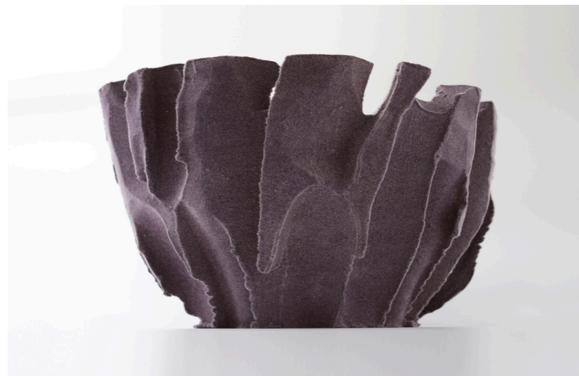
Ci-dessus - Second Nature 43, 2021, céramique flochage, 22 x 30 cm Page de droite - Second Nature 18, 2021, céramique flochage, 24 x 40 cm

extrait du texte de Sophie Bernal écrit pour l'exposition Minéral en 2021