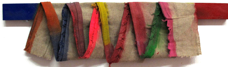
Ci-dessus - ZIG ZAG, 2022, Bois, toile de lin, peinture aérosol, 15 x 55 cm

L'artiste utilise ainsi du bois, de la corde, des caquettes, ou des torchons qu'il trempe dans la couleur, qu'il découpe et qu'il assemble avec une grande sensibilité de composition. La sensualité des formes, qui maintiennent leur équilibre et leur déséquilibre, s'unissent en harmonie avec la profonde vivacité des encres et des acryliques. Tout cela fait écho à la pratique plus habituelle de l'artiste, qui s'étend plutôt sur toile. Dans cette série, où il trouve une forme d'amusement, Guillaume Moschini sort de ce médium, déconstruit le tableau et pense chaque œuvre en mémoire de toutes ces influences.