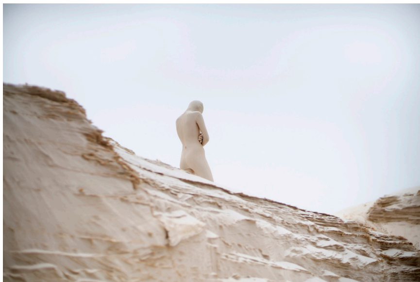
Ci dessus - The girl who fell to earth 11, 2018, tirage contrecollé sur alluminium, encadré, 50 x 75 cm Page de droite - The girl who fell to earth 1, 2018, tirage contrecollé sur alluminium, encadré, 50 x 75 cm

extrait du texte de Sophie Bernal écrit pour l'exposition Minéral en 2021