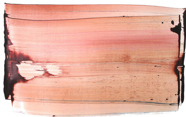
Ci-dessus - LAST HOUR 04, 2021, Acrylique et pigments sur papier format horizontal, 50 x 65 cm Page de droite - MOUNTAIN 03, 2022, Acrylique et pigments sur papier format vertical, 50 x 65 cm

extrait du texte de Pauline Faivre écrit pour l'exposition Végétal en 2022